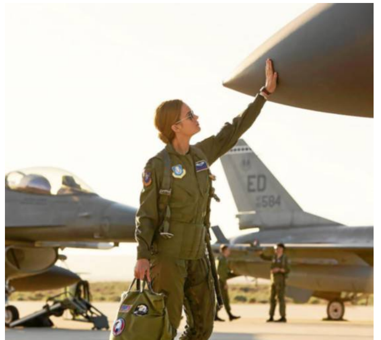
« Captain Marvel », aux Baladins de Lannion.

• Plestin-les-Grèves. Au Douron, aujourd'hui à 17 h 30.